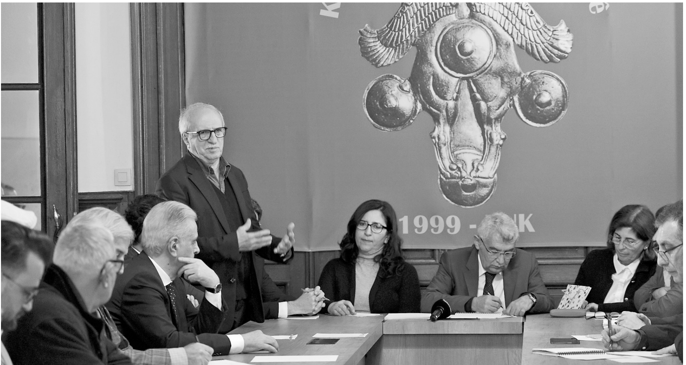
Anfang 2025 kamen Vertreter:innen von einem Großteil der Parteien Rohhilats im KNK-Büro in Brüssel zusammen und bildeten eine Kommission für die Einheit aller Parteien und Organisationen Rohhilats.

tiger Ziele geopfert wurde. Wenn lokale Infrastrukturen nicht ausreichend finanziert sind und die Entscheidungsfindung zentralisiert bleibt, geraten die Provinzen in einen Kreislauf aus Abhängigkeit und Rückständigkeit.