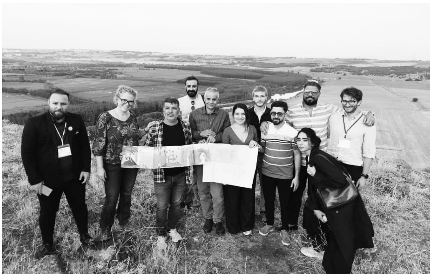
Teilnehmer:innen des Forums