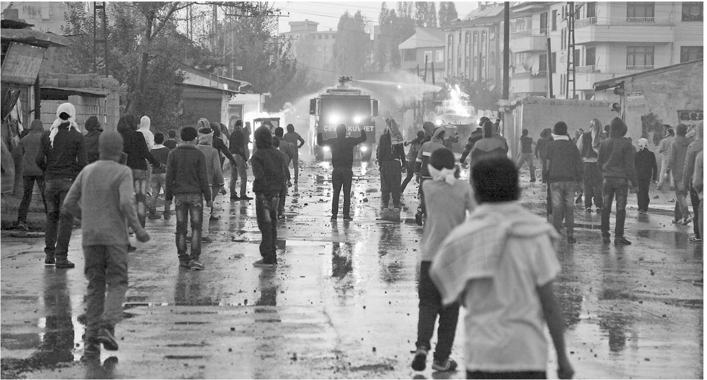
Die Jugendbewegung YDG-H 2013 in Nordkurdistan.

Kinder wurde ein Ausbildungssystem errichtet, das letztlich auf Repression und Lügen basiert.