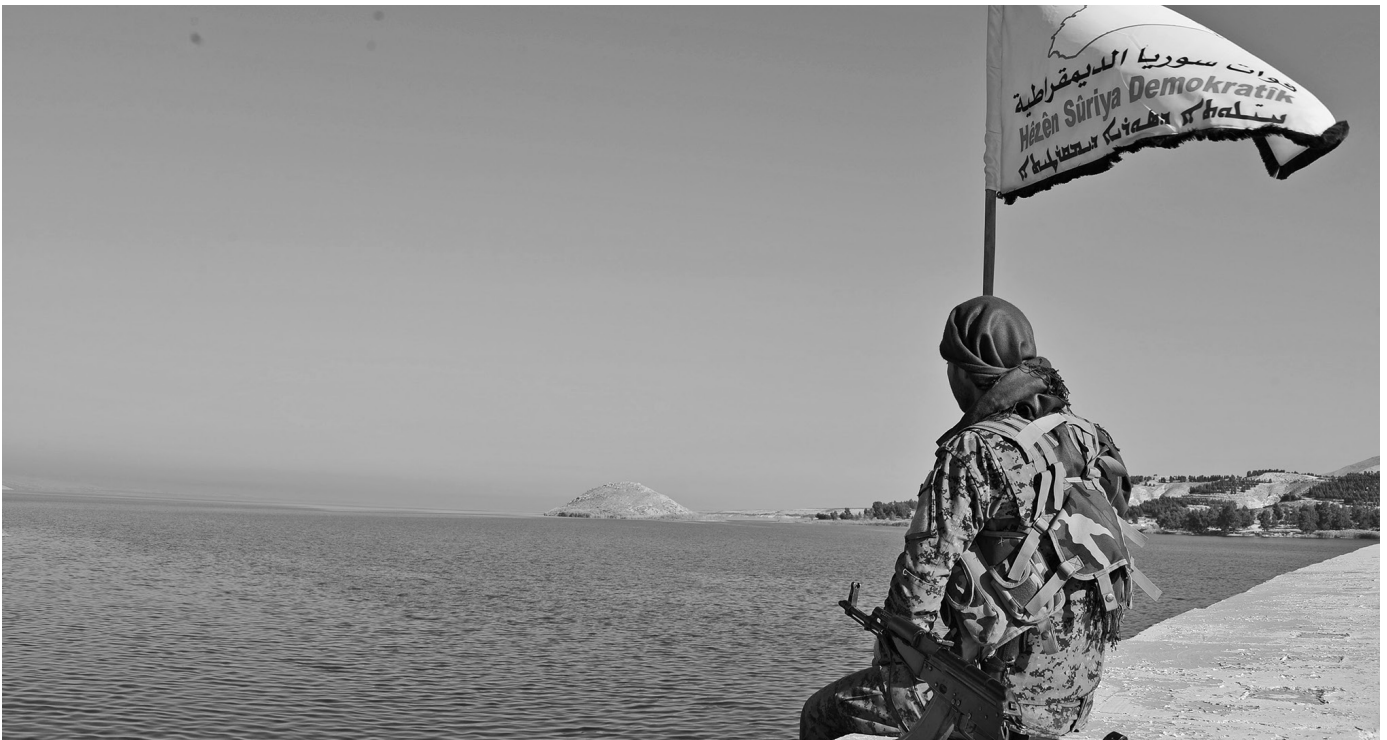
Die Tişrin-Talsperre am Euphrat in Nordsyrien.

des Konzepts der Dezentralisierung. Damaskus neigt dazu, dies als eine Verwaltungsformel unter zentraler Aufsicht zu betrachten, während die SDF darauf besteht, dass dies eine echte demokratische Beteiligung und gegenseitige Anerkennung beinhalten muss. Der Weg nach vorne erfordert, dass beide Seiten diese Unterscheidung akzeptieren, um eine Wiederholung zentralistischer Muster zu vermeiden, die das Risiko eines erneuten Konflikts bergen.