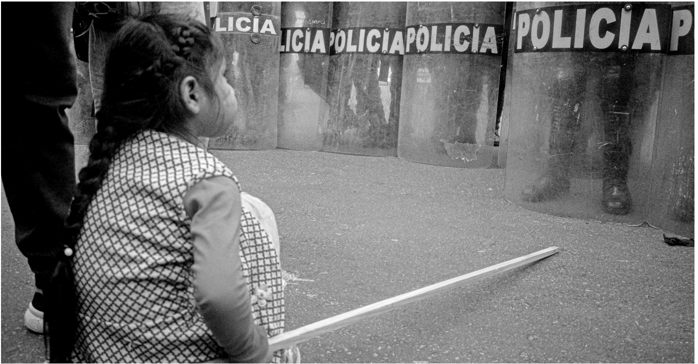
Ein Mädchen bei den Protesten in Peru 2025.