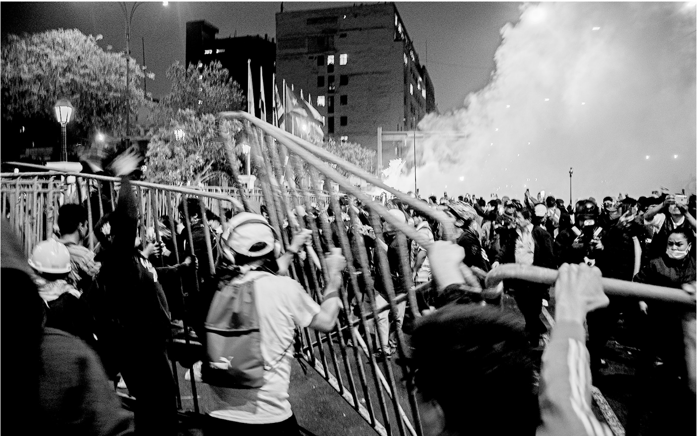
Konkrete Auslöser für Protestphase in Peru seit September 2025 waren unter anderem eine Rentenreform, ansteigende Gewalt und Unsicherheit und insbesondere die Situation der Schutzgelderpressungen von Busfahrer:innen.

Aufschwung Zufriedenheit in Teilen der Bevölkerung und sollte noch über die Regierungszeit Fujimoris hinaus für eine anhaltende neoliberale Wirtschaftspolitik sorgen.