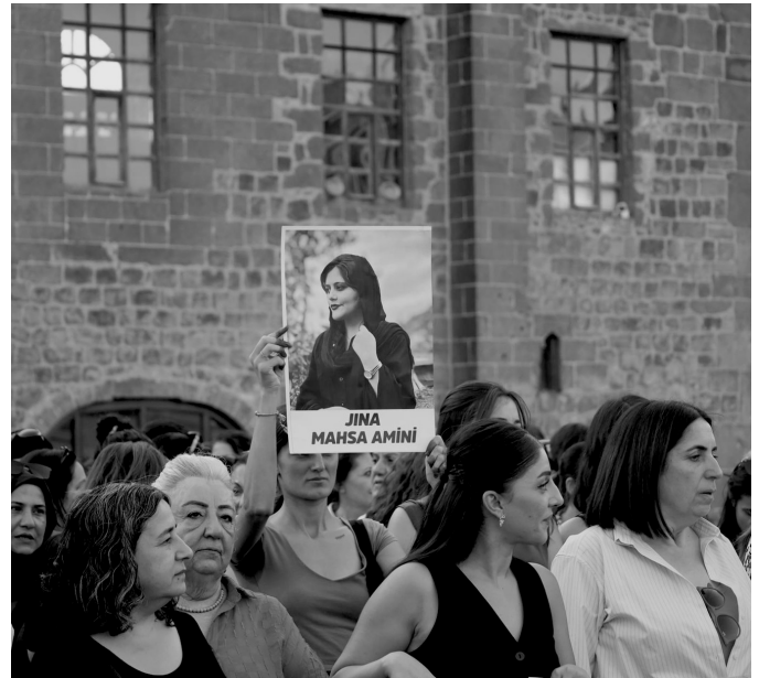
Immer wieder gehen Menschen in Solidarität mit den Protestierenden im Iran und in Rojhilat weltweit auf die Straße, wie hier 2025 in Amed (tr. Diyarbakır).

Ein zweites Szenario geht von zeitweiligen Zugeständnissen des Staates wie z.B. gezielten Hilfsmaßnahmen, begrenzten Lohnerhöhungen, eingeschränkter Strafverfolgung in Verbindung mit einer anhaltenden Unterdrückung politischer Stimmen aus. Dies würde zu einer prekären Stabilität führen. Streiks und Proteste würden episodisch fortgesetzt, aber es käme nicht zu einer einheitlichen nationalen Bewegung. Lokale Verhandlungen (z. B. Vereinbarungen mit Lkw-