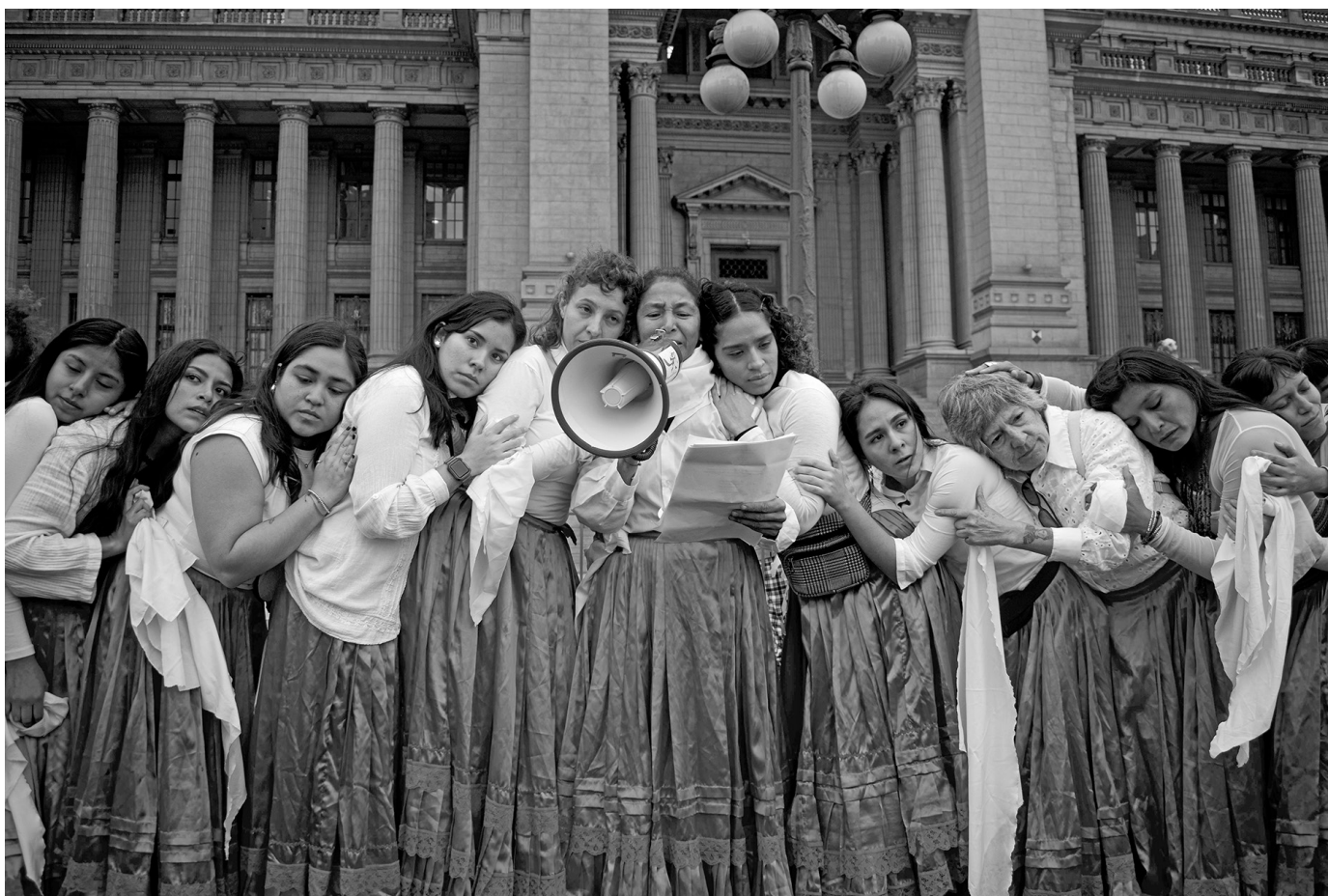
In den Protesten Perus nehmen Frauen eine zentrale Rolle ein.

che Spaltung zwischen Stadt und Land. Was aus Perspektive europäischer Ignoranz unter »Indigenen« zusammengefasst wird, drückt sich nur auf dem Gebiet des peruanischen Staates in mindestens 22 verschiedenen indigenen Sprachfamilien aus, und 55 anerkannten indigenen Bevölkerungen, alle mit eigenen Kosmvisionen und spezifischer gesellschaftlicher Organisation. Diese Vielfalt in allen Lebensbereichen erschwert den Aufbau eines zentralisierten Staatsapparats nach europäischem Modell. Das Ideal einer homogenen, nationalistischen Demokratie westlicher Prägung stößt hier an seine Grenzen. Und doch entstehen in den Zwischenräumen staatlicher Abwesenheit immer wieder neue Formen sozialer Organisation – Gemeinschaften, die dort, wo der Staat versagt, eigene Wege des Überlebens und Widerstands finden.