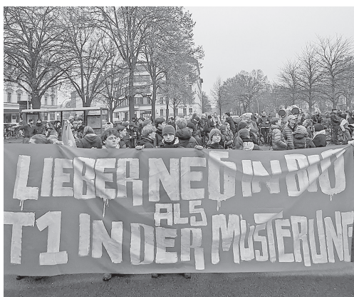
»Lieber ne 6 in Bio als T1 in der Musterung« steht auf dem Banner der Schulstreikenden in Berlin am 5. Dezember 2025.