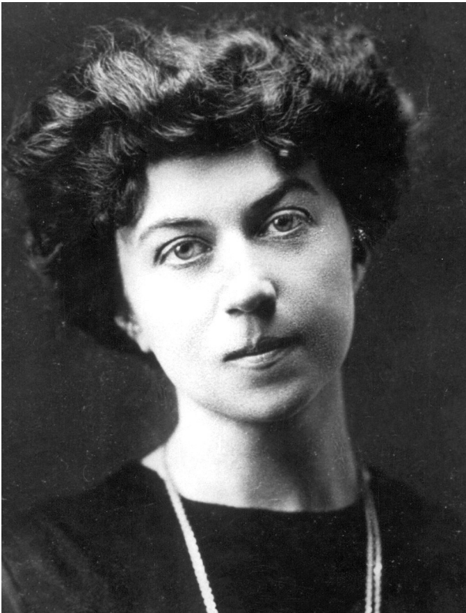
Alexandra Kollontai ebenso wie Clara Zetkin und Rosa Luxemburg kamen der Wahrheit des Sozialismus näher als Karl Marx oder andere männliche Vordenker.

Der demokratische Sozialismus ist weder ein der Gesellschaft aufgezwungenes Konstrukt noch ein Konzept, das von der sozialen Natur des Menschen entfremdet ist. Er ist eine konkrete Lebensweise, die auf Freiheit, Gemeinschaftlichkeit und Vielfalt basiert. Er steht im Gegensatz zum Kapitalismus, der auf Ausbeutung und Gewalt basiert, und auch zum Liberalismus, der sich auf individuelle und falsche Freiheit konzentriert. Im sozialistischen Verständnis spielen sowohl das Individuum als auch das Kollektiv eine Rolle in der Gesellschaft und stehen in einem organischen Gleichgewicht zueinander. Der demokratische Sozialismus ist gerade für uns als junge Frauen von zentraler Bedeutung, weil er mit unserer Geschichte verwoben und Teil unserer Identität ist.