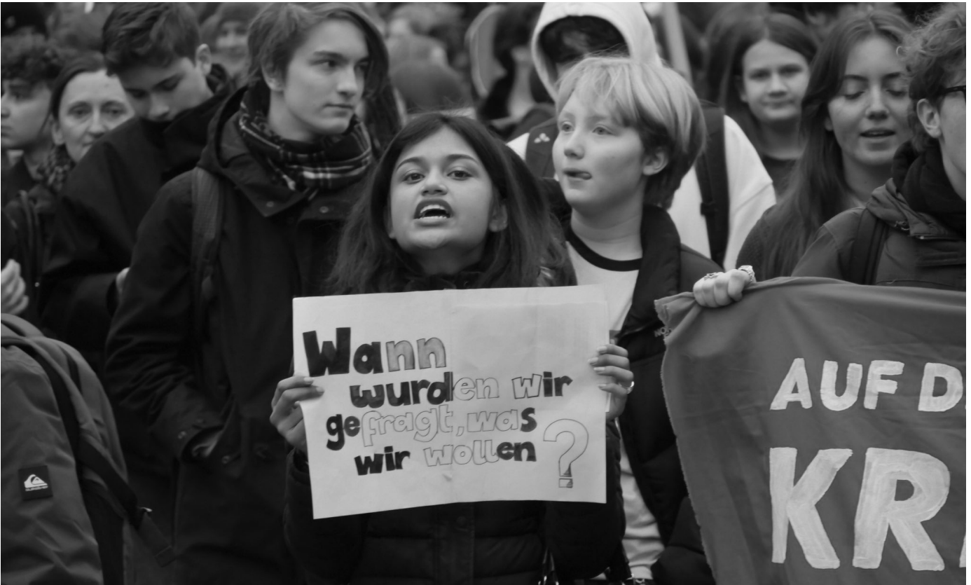
Bei einer Demonstration im Zuge des Schulstreiks gegen die Wehrpflicht im Dezember 2025 hält eine junge Frau ein Schild mit der Frage: »Wann wurden wir gefragt, was wir wollen?«.