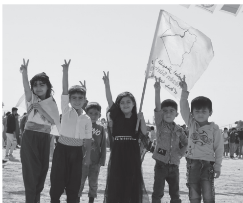
Der Hoffnung der Syrer:innen, dass der Sturz Assads den Beginn einer neuen Phase markieren und die mehr als vierzehn Jahre Krieg beenden würde, stehen auch ein Jahr nach dem Sturz des Baath-Regimes verschiedenste Faktoren entgegen.