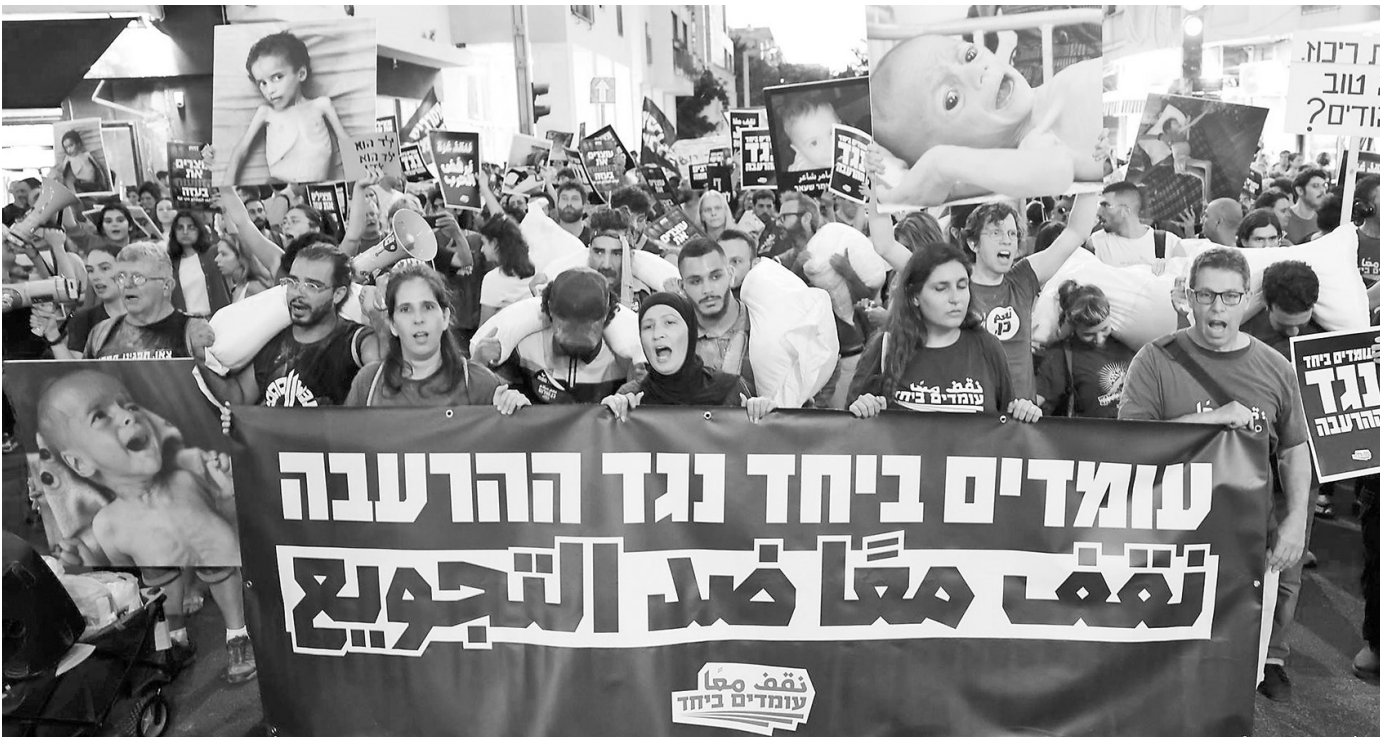
Auch in Israel wächst das Aufbegehren von Teilen der Zivilgesellschaft gegen Krieg und Zerstörung durch Israel, wie hier Anfang August 2025 in Tel Aviv.

die USA die QSD 1 taktisch unterstützen, so handelt es sich nicht um Unterstützung für ein »transformatives politisches Projekt«, sondern um ein Mittel zur Schaffung »regionaler Balance«.