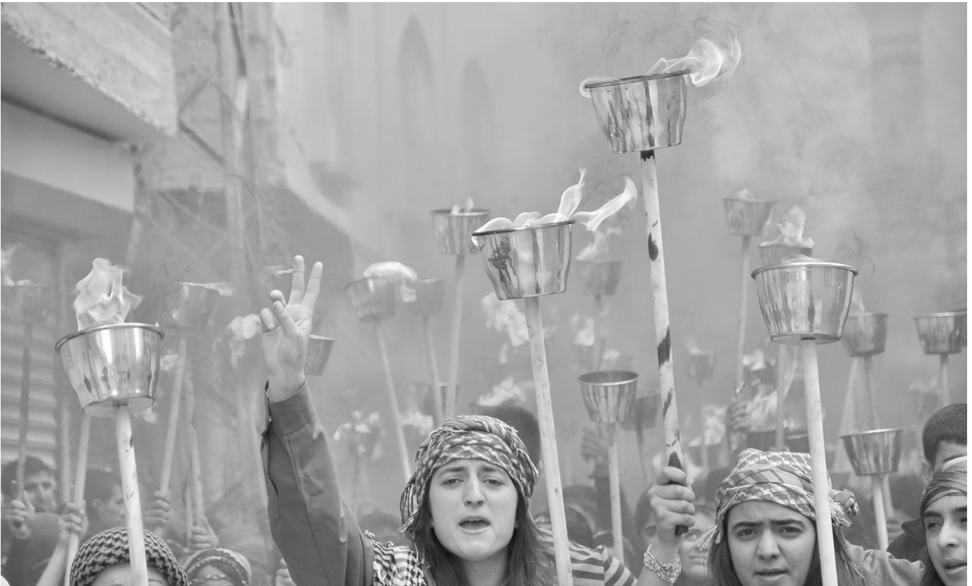
Kurdische Jugendliche demonstrieren zu Newroz in Nisêbin (tr. Nusaybin).

Gemeinsamkeiten ausgehen, um eine Einheit, eine gemeinsame Kultur der Jugend zu entwickeln. Wir sehen diesen Wunsch nach Einheit in der One-Piece-Flagge, die als Symbol der Gen-Z-Proteste im Himmel aller Kontinente wehte. Es gibt diese Grundlage für die Bildung eines gemeinsamen Bewusstseins der Jugend, wenn wir den Willen haben, daran zu arbeiten.