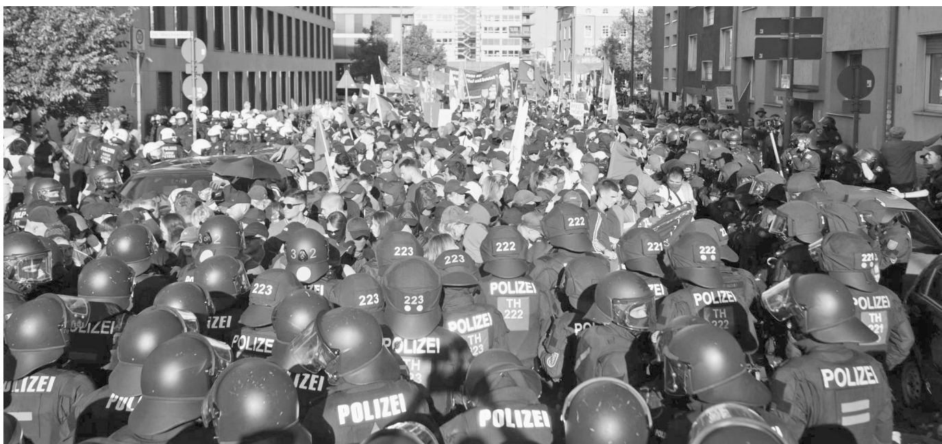
Demonstrationen des Rheinmetall Entwaffnen Bündnisses wird von Seiten der Polizei häufig mit heftiger Gewalt begegnet, hier am 30. August 2025.

weit entfernte Staaten, sondern schürt den Krieg in Osteuropa gemeinsam mit den Verbündeten. Den eigenen Kriegseintritt nimmt er damit zumindest in Kauf. »Deutschland nutzt den Stellvertreterkrieg und eine vermeintliche abstrakte moralische Überlegenheit dafür aus, seine globalen wirtschaftlichen Interessen militärisch noch effektiver durchzusetzen.« analysiert das Bündnis. Damit rückt die direkte deutsche Kriegsbeteiligung in den Fokus. Auf diese imperialistische Machtprojektion wird mit Aktionen und Demonstrationen reagiert.