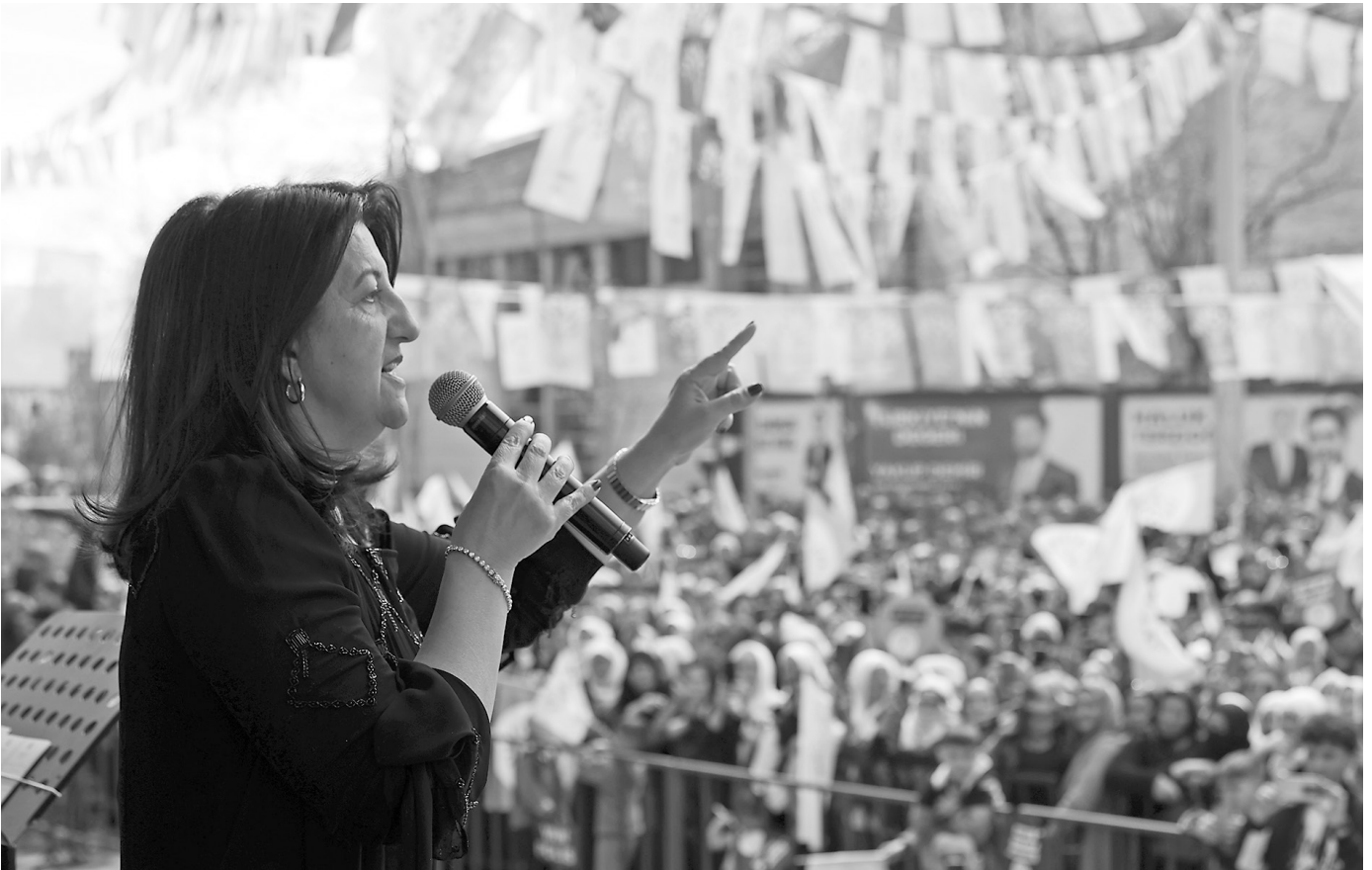
Seit Januar 2013 nahm Pervin Buldan, zurzeit Ko-Vorsitzende der DEM Partei, an sämtlichen Delegationen der DEM-Partei, bzw. HDP auf die Gefängnisinsel İmralı teil, um in den Gesprächen mit Abdullah Öcalan insbesondere die Perspektive der Frau einzubringen.