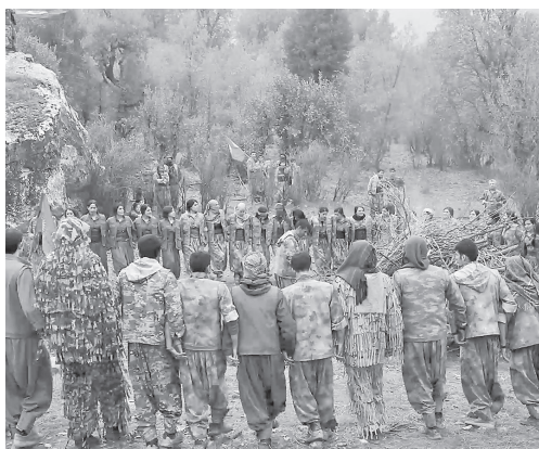
Nach der Ausrufung ihres Waffenstillstandes im März 2025 hat die PKK sich im November 2025 aus Teilen des Zap in Nordkurdistan zurückgezogen. Tatsächlich gab es zumindest in den letzten Monaten des Jahres 2025 nur wenige Angriffe von Seiten der Türkei.