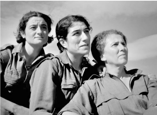
Sakine Cansız (rechts) hielt sich in Europa auf, um eine Lösung für die kurdische Frage voranzubringen. Am 9. Januar 2013 wurde sie von einem türkischen Agenten in Paris ermordet.