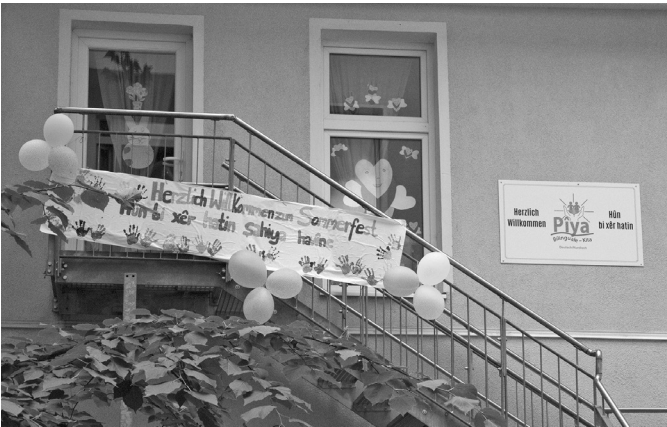
Die Kita Piya Wedding ist die weltweit erste bilinguale kurdisch-deutsche Kindertagesstätte. Mitten im Wedding wurde sie auf Wunsch der Eltern gegründet.

Kindergarten besucht, seine Gefühle leichter ausdrücken und seine kurdische Identität, also seine Beziehung zu seiner Kultur, entwickeln kann, während er gleichzeitig Deutsch lernt.