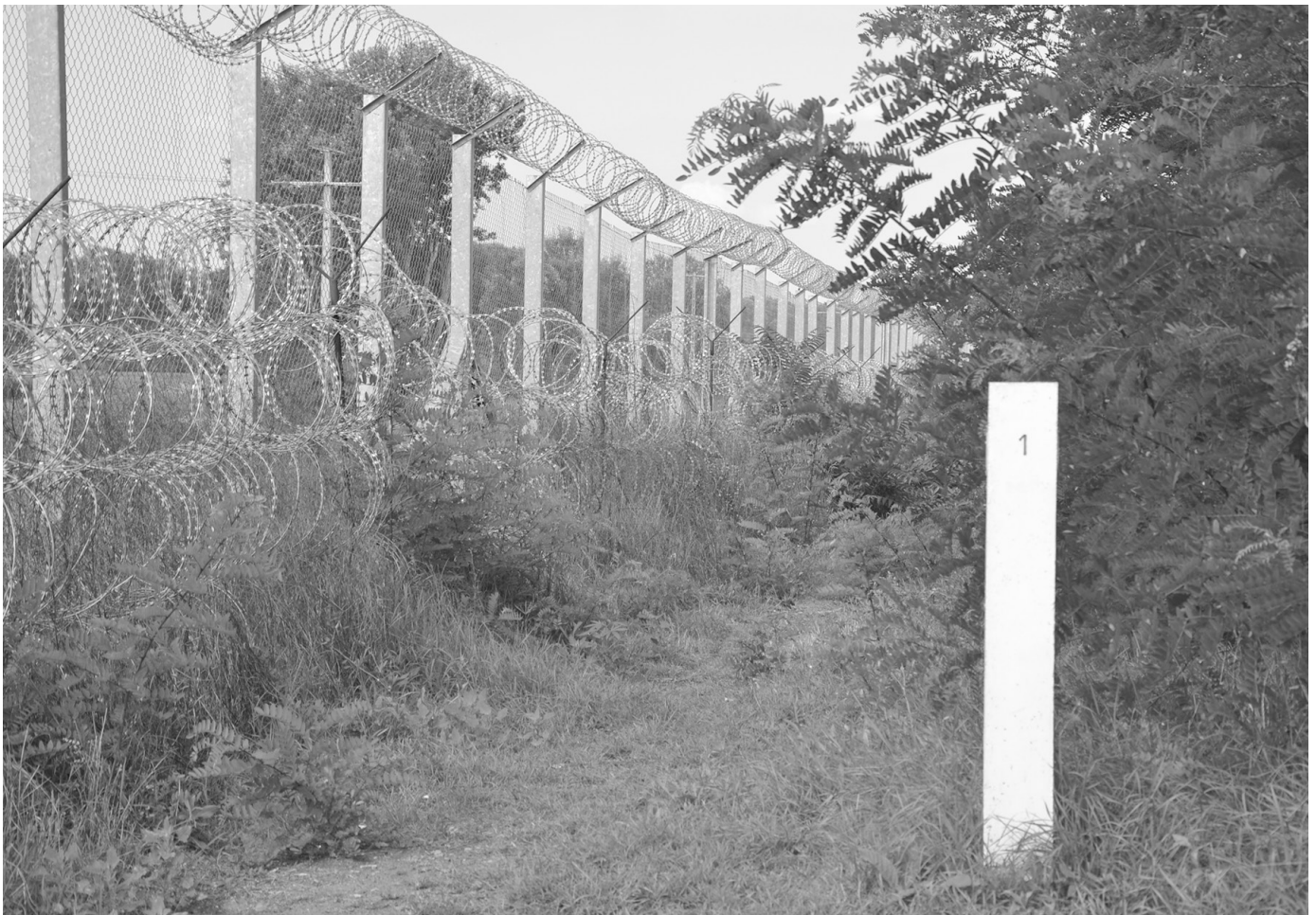
Zaun an der ungarisch-serbischen Grenze.

Jedes Volk hat seine eigene Moral, Tugenden und Träume. Obwohl nie klar ausgesprochen, war mir schon als Kind klar: Das kurdische Ideal ist die Freiheitskämpferin, bzw. der Freiheitskämpfer. Wer wie der Schmied Kawa 1 der Übermacht des Bösen mutig entgegen tritt, verdient sich maximalen Respekt und die Liebe des Volkes. In Zeiten des Krieges war dieser Traum immer verbunden mit Soldatentum. Ob Pêşmerge oder Guerillakämpfer:in, Spiegelbild dieses Ideals waren immer die, die die Waffe in ihren Händen hielten. Mit dem Einläuten des neuen Friedensprozesses wird dank der Wandlungsfähigkeit der Freiheitsbewegung auch mit diesem Bild gebrochen. Von nun an wird unser Erfolg daran gemessen, inwieweit sich die Gesellschaft organisieren wird, inwieweit sie für ihre, mit dem Blut zehntausender Gefallenen erkämpfte Identität und ihre Rechte einsteht. Alle, die mit diesem Bewusstsein in die Heimat zurückkehren können von nun an Freiheitskämpfer:innen werden.