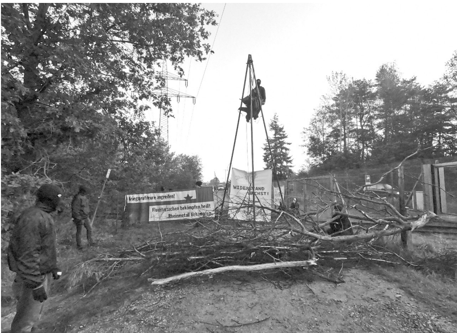
Eine Blockade im Zuge der Rheinmetall Entwaffnen Aktionstage 2019.

In den letzten Jahren zeigte sich häufiger die Tendenz des »Rheinmetall Entwaffnen« Bündnisses Widersprüche in der