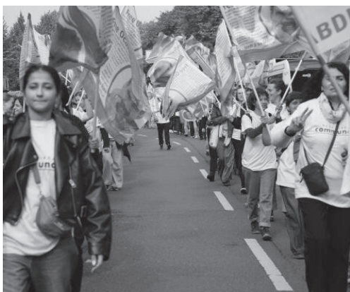
Auf dem Langen Marsch für die Freiheit Abdullah Öcalans kamen im vergangenen September über 150 Jugendliche aus mehreren europäischen Ländern zusammen: "Wir sind hier um gemeinsam zu demonstrieren, die Revolution aufzubauen und einen konkreten Internationalismus zu leben"