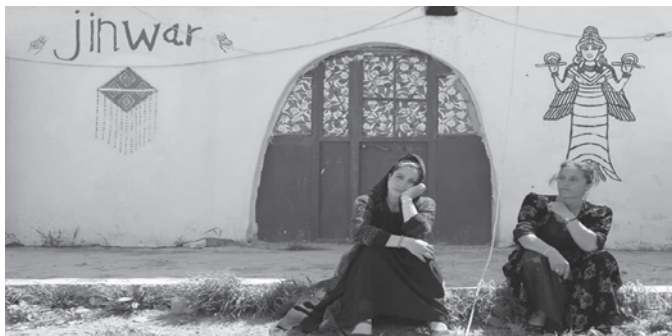
Frauen im Frauendorf Jinwar.

Die Jineoloji erachtet die Freiheit der Frau als zentrales Thema und weist dem Raum ein bedeutendes Forschungsfeld zu. Es gilt, die Beziehung zwischen Sein und Raum zu untersuchen, indem der Einfluss des Raumes auf die Formung des Menschen, der Zusammenhang zwischen dessen Befreiung und dem Raum, sowie konkrete Erfahrungen betrachtet wer-