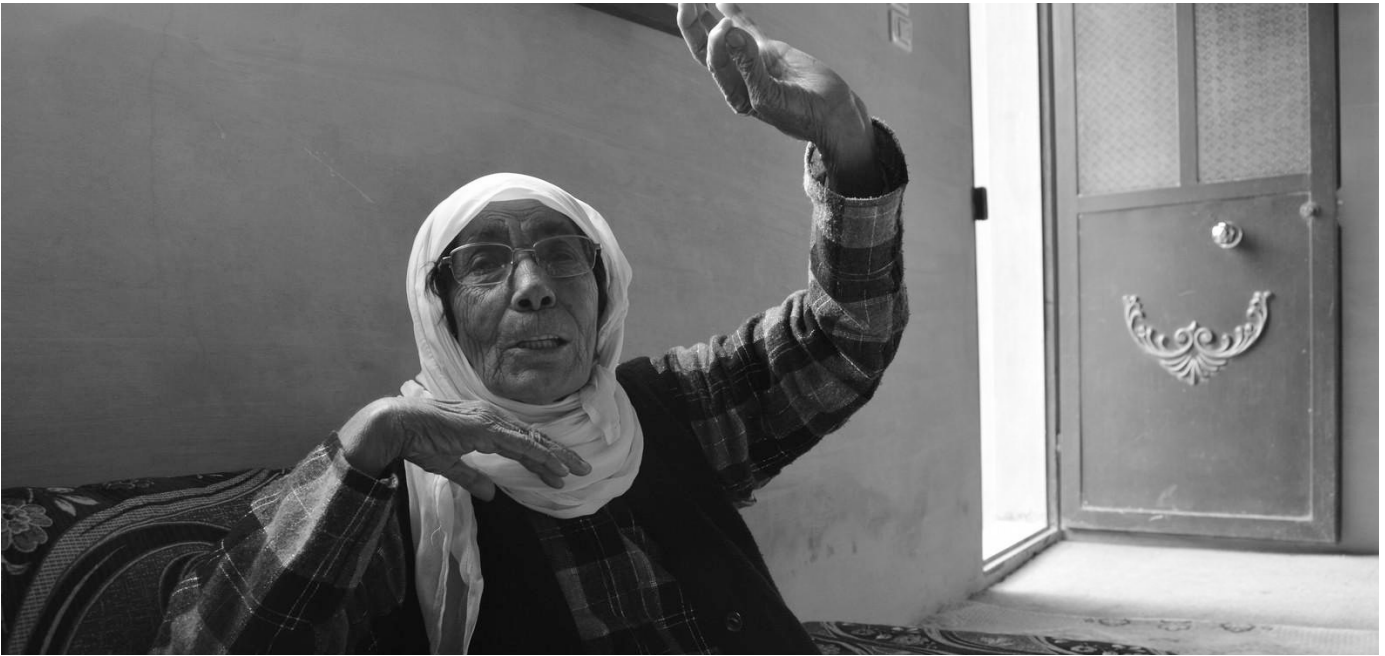
Im Zusammenhang mit der Forschung der Jineoloji erzählt eine ältere Frau aus früheren Zeiten.

ckelt, das die Bedürfnisse von Frauen, Behinderten und anderen sozialen Gruppen berücksichtigt, und nicht mehr nur ein Arbeitsprogramm und Raumverständnis beinhaltet, die nur Männer berücksichtigen und in den Mittelpunkt stellen.