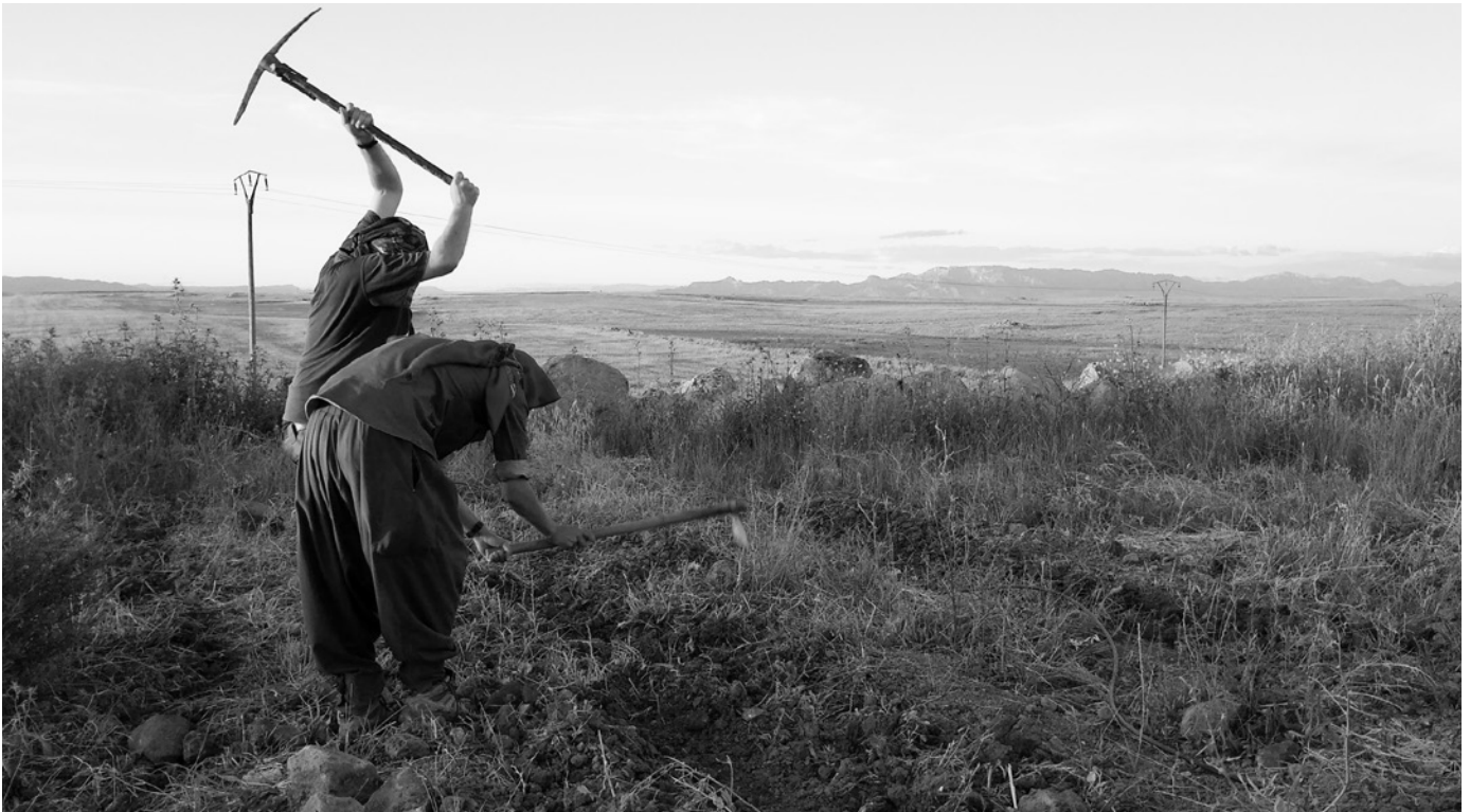
Kooperative Landwirtschaft in Rojava.

Diese Praxis ist als vorübergehende Lösung der unmittelbaren Probleme von Menschen entstanden, die kriegsbedingt unter starkem Einkommens- und Nahrungsmangel leiden. Sie hat sowohl positive als auch negative Folgen für die Organisation der Sozialwirtschaft selbst. Solange die Kooperative nicht als Institution etabliert ist und das Land nicht endgültig an die Menschen übergeben wird, wird die kooperative Arbeit für die Menschen selbst nicht zu einer kontinuierlichen und täglichen wirtschaftlichen Tätigkeit. Deshalb gehen die Leute, die sich an landwirtschaftlichen Kooperativen beteiligen, anderen wirtschaftlichen Tätigkeiten nach, um ein regelmäßiges Einkommen zu haben, mit dem sie das ganze Jahr über leben können, auch wenn sie mit dem Einkommen aus der landwirtschaftlichen Kooperative ihren Lebensunterhalt für die Hälfte des Jahres sichern können.