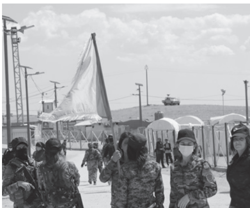
Die Intensität der Angriffe auf Rojava und auf die demokratische Selbstverwaltung Nord- und Ostsyrien hat im Vergleich zum Anfang des Jahres zwar abgenommen, sie halten aber weiter an. In den vergangenen Monaten wurde auch der Tîşrîn-Staudamm wieder mehrfach bombardiert.