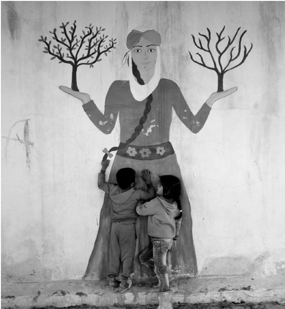
Ein Wandbild im Frauendorf Jinwar.

oder wertlose Arbeit bestimmt wurde. Aus diesem Grund ist es für Frauen äußerst wichtig, am Marktgeschehen teilzunehmen, und ihre eigenen Produkte ohne Zwischenhändler direkt an die Verbraucher:innen liefern zu können. Die Gemeinde Amed Bağlar hat zu diesem Zweck den Frauenmarkt eingerichtet. Da die Männer den Markt jedoch für sich beanspruchten, war es nicht einfach, diese Arbeit fortzusetzen. Die Frauen mussten tagelang Wache halten, um den Markt vor den Männern zu schützen.