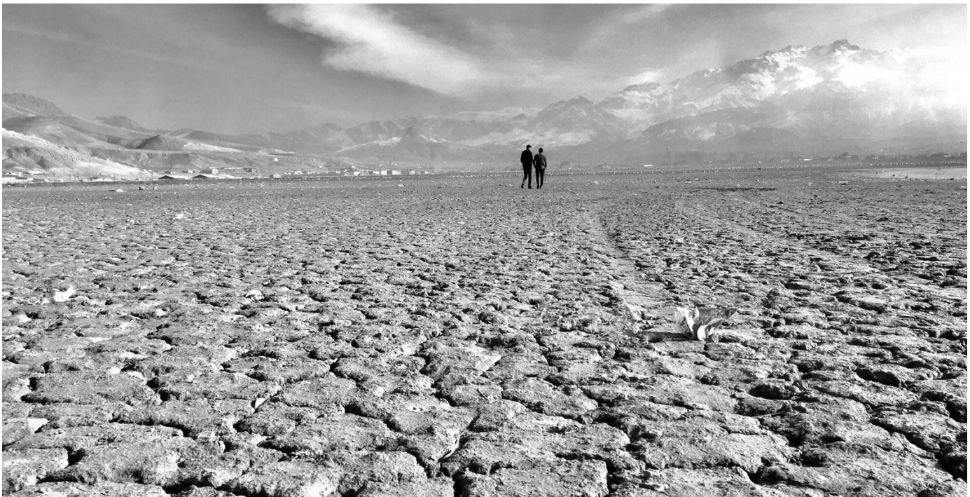
Staudämme sind ein wesentliches Mittel, wie die Türkei Wasser in der Region Mesopotamiens über die eigenen Ländergrenzen hinweg kontrolliert. Doch auch in der Türkei selbst trocknen Seen durch den Bau von Staudämmen aus, wie hier der Sixké-See im Landkreis Rêya Armûşê.

zeichnen es begrifflich als Hydrohegemonie. 2 Das bedeutet, dass ein Staat oder ein mächtiger Akteur die Kontrolle über gemeinsame Wasserressourcen mit politischen, wirtschaftlichen oder militärischen Mitteln ausübt.