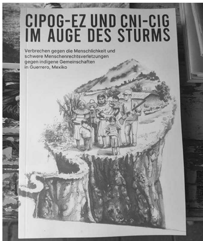
Der Bericht über die Angriffe auf Gemeinden des CIPOG-EZ erschien im August 2025 unter dem Titel »CIPOG-EZ und CNI-CIG im Auge des Sturms« erstmals auf deutsch. Weitere Informationen am Ende des Artikels.

die kapitalistische Erschließung unserer Territorien bedeutet.« Kommunikation wird zur Überlebensfrage, zur Form des politischen Selbstschutzes in einem Krieg um das Territorium und zum praktischen Werkzeug für die Dörfer-übergreifende Organisation. Das Radio ist auch ein Instrument der kollektiven Erinnerung: Es dokumentiert Angriffe, erzählt Geschichten des Widerstands und trägt die Stimme der Gemeinde hinaus in die Welt – denn der lokale Aufbau und die Verteidigung der Kommunalität in den Gemeinden des CIPOG-EZ wird begleitet durch internationale Solidarität mit und durch weitere Widerstandsbewegungen, dem Lernen mit- und dem Beziehen aufeinander, das Erkennen eines gemeinsamen Kampfes: