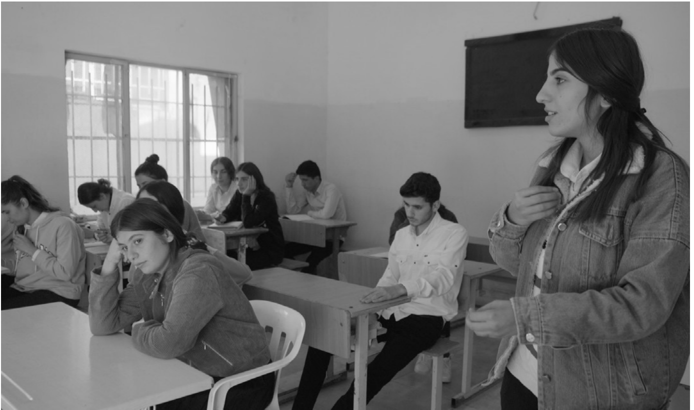
Eine Schule im Camp Mexmûr.

Für sie ist klar: »Der Staat 12 muss dem Aufruf von Abdullah Öcalan folgen. Wir wollen ein friedliches und würdiges Leben. Wir wollen in Würde in unser Land zurückkehren, nicht in Kapitulation.« Die Menschen wollen ihr politisch-gesellschaftliches System in Bakur fortführen. Der Prozess dahin muss transparent ablaufen und die Informationen darüber müssen kontinuierlich fließen.