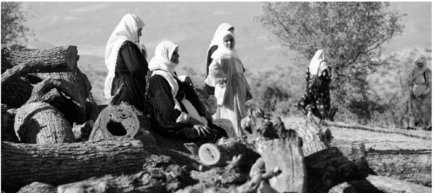
Auch die massive Rodung von Bäumen in besetzten Gebieten stellt eine Form dar, wie die Türkei durch die Kontrolle der Ökologie ihre Hegemonie in der Region zu stärken versucht.

»Lösungen« weit davon entfernt, eine Antwort auf das Problem zu sein. Sie manipulieren weiterhin die Wahrheit.