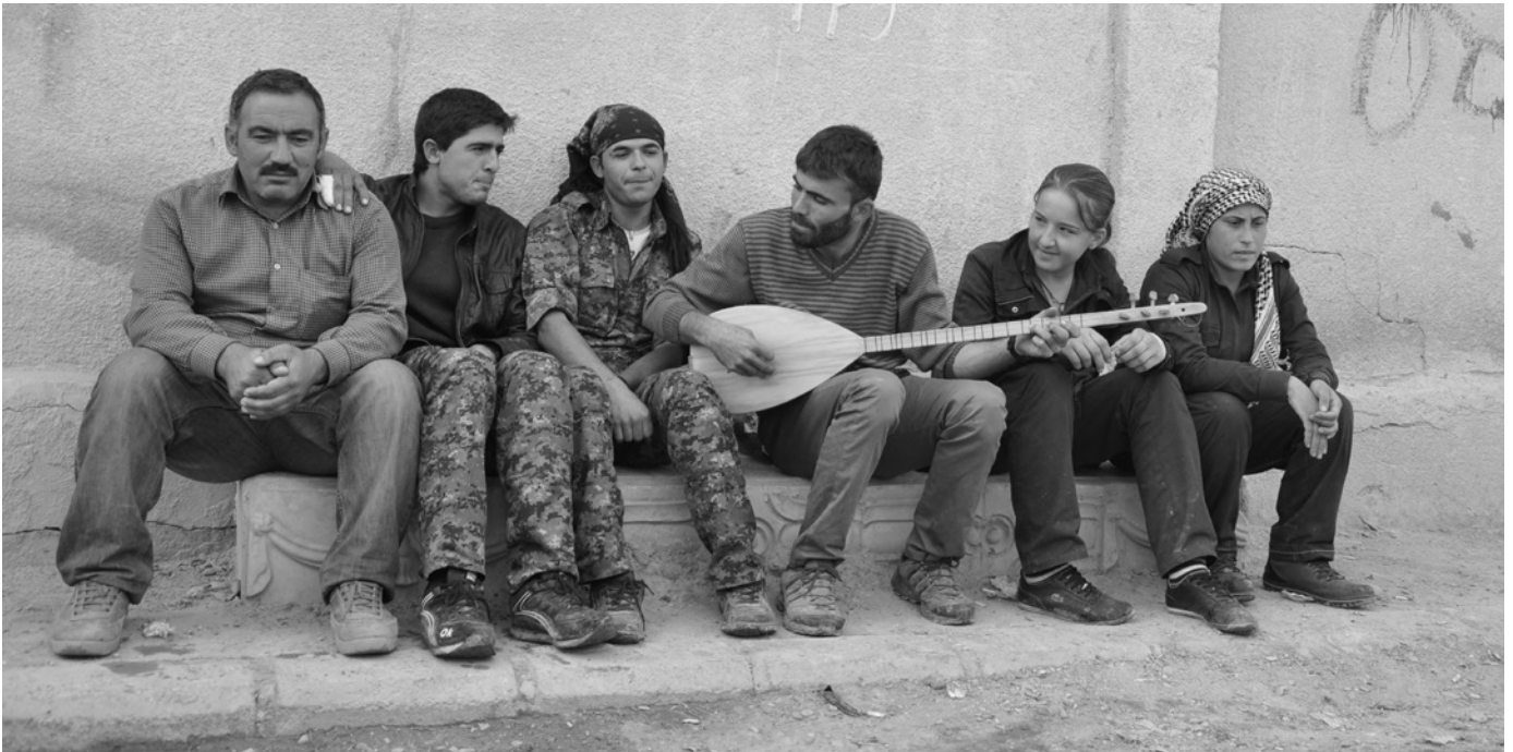
Die Gesellschaft der Stadt Kobanê im Norden Syriens verwaltet sich seit über 10 Jahren selbst. In Kobanê nahm die demokratische Selbstverwaltung Nord- und Ostsyrien am 19. Juli 2012 ihren Anfang.

satz verfolgt. Frauen haben das Recht auf Selbstverteidigung, und dieses Recht ist nicht nur individuell, sondern als organisiertes Verteidigungssystem konzipiert. Es wird eine neue Epistemologie namens Jineolojî (Wissenschaft aus der Perspektive der Frau) entwickelt. Diese Erfahrung zeigt zwar, dass demokratische Verwaltung auch unter Kriegsbedingungen möglich ist, steht jedoch vor verschiedenen Herausforderungen wie Wirtschaftsembargo, militärische Angriffe, interne Widersprüche und der Widerstand traditioneller Strukturen.