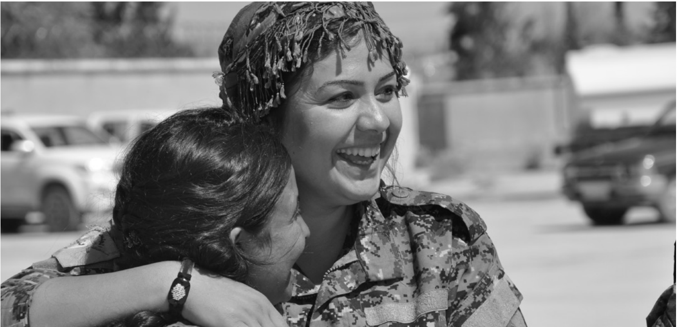
Seit Dezember 2024 ist die nordsyrische Stadt Minbic von Milizen der SNA besetzt und es herrscht Angst unter der Bevölkerung. Das Foto zeigt arabische Frauen, die noch im Jahr 2017 eine eigene Frauenverteidigungseinheit in der Stadt gründeten.

Bei einer öffentlichen Veranstaltung im Mai erklärte der ehemalige US-Botschafter für Syrien: »Im Jahr 2023 lud mich eine britische Nichtregierungsorganisation ein, dabei zu helfen, diesen Mann [Ahmed al-Sharaa] aus der Welt des Terrorismus herauszuführen und in die reguläre Politik zu integrieren.«