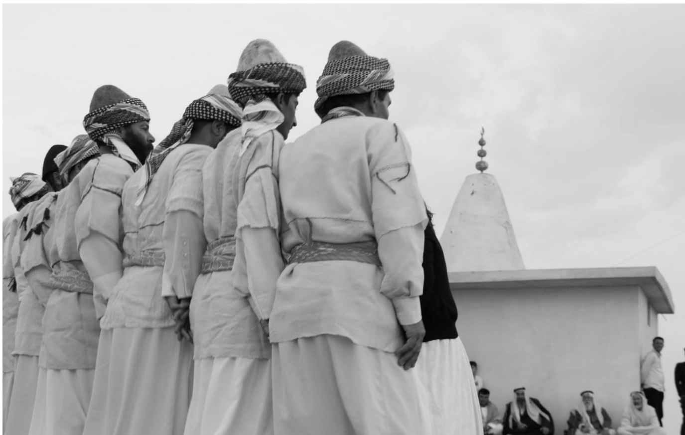
Die demokratische Nation ist ein Bund, ein Mosaik von Völkern. Dazu gehört auch die Vielfalt der Kulturen, wie hier auf dem Kunst- und Kulturfestival in Şengal.

schaft der demokratische Konföderalismus einen Rahmen, in dem alle Gesellschaften innerhalb einer gleichberechtigten Union aufblühen können – nicht trotz, sondern gerade wegen ihrer Unterschiede. Dieses Modell ist nicht nur theoretische Spekulation – es wird in der Demokratischen Selbstverwaltung Nord- und Ostsyriens (DAANES) praktisch umgesetzt, wo Kurd:innen, Araber:innen, Syrer:innen, Armenier:innen, Turkmen:innen, Muslim:innen, Jesid:innen und Christ:innen gemeinsam regieren, durch demokratische Institutionen, die auf dem Prinzip kollektiver Handlungsmacht beruhen 10 . Repräsentation ist dabei nicht symbolisch: Quoten sichern die echte Beteiligung von Frauen und Jugendlichen. Jeder Rat wird von einer Frau und einem Mann gemeinsam geleitet. Frauenhäuser (Mala Jin) und autonome Frauenstrukturen sind auf allen Ebenen der Entscheidungsfindung integriert 11 . Jugendliche sind nicht nur Gegenstand von Politik, sie machen selbst Politik.