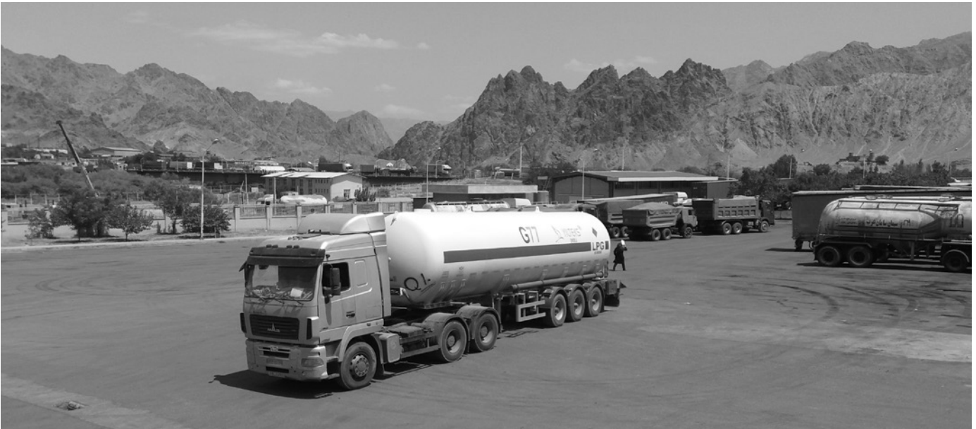
Ein LKW mit Flüssiggasladung an der iranisch-armenischen Grenze. In Zukunft sollen die Transportwege zunehmend durch effizientere Pipelines ersetzt werden.

und stand Damaskus seit dem Aufstand von 2011 auf allen Ebenen bei. Zudem kontrolliert Teheran weiterhin militärische Kräfte im Irak, was das Land zu einem akuten Krisenherd macht – mit direkten Folgen für die Kurd:innen, da insbesondere die von der PUK kontrollierten Gebiete an Rojhilat (dem iranisch besetzten Teil Kurdistans) grenzen.