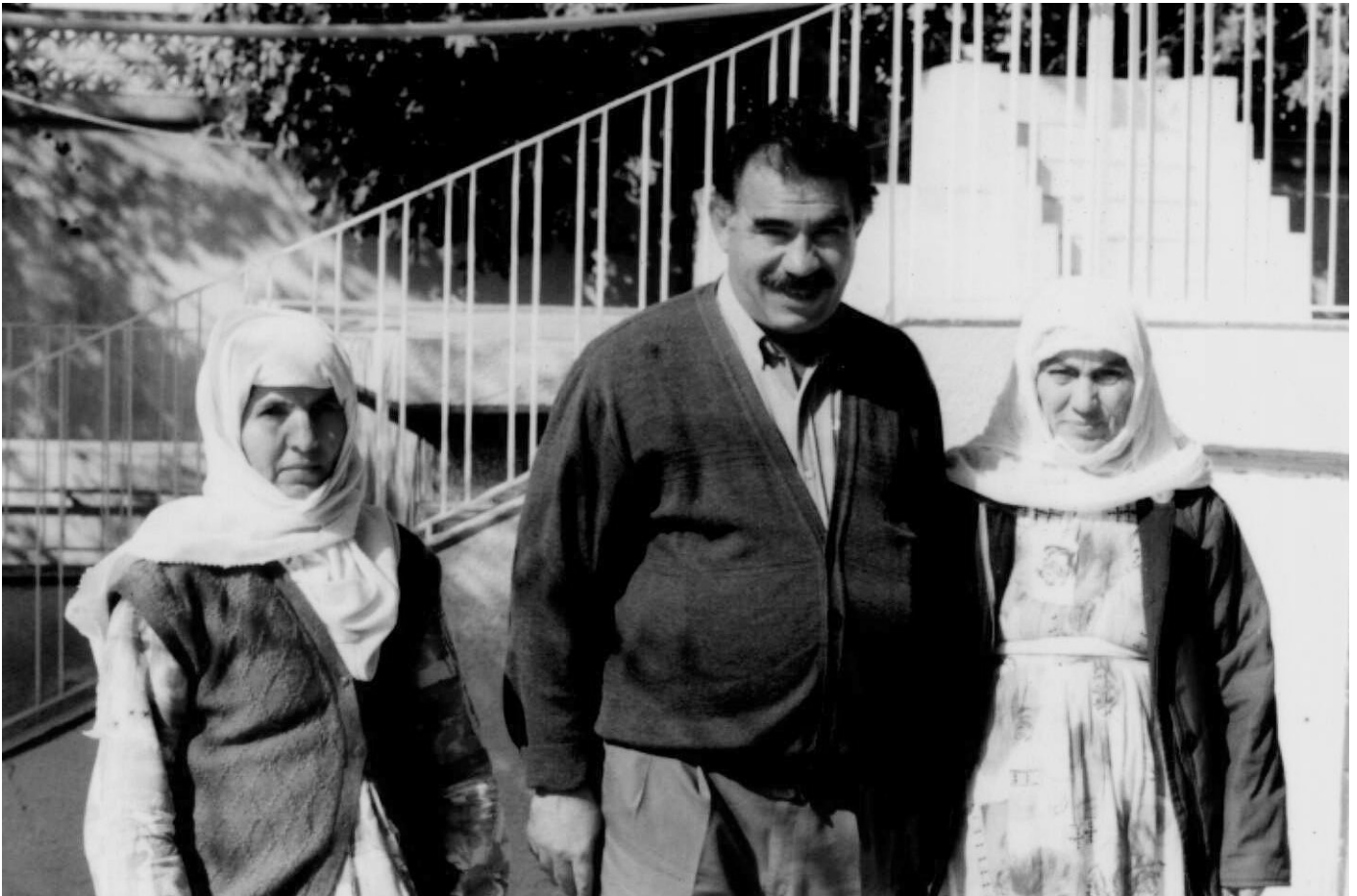
Abdullah Öcalan hatte eine zentrale Rolle darin, dass die kurdische Befreiungsbewegung das sozialistische Paradigma des 20. Jahrhunderts weiterentwickelte und das neue Paradigma, in dem die Kommune im Mittelpunkt steht, in die Praxis umsetzte.

sondern zu seinem Objekt. Die Partei hat das Wissen, die Massen lernen. Die Partei entscheidet, die Massen führen aus. Die Folgen dieses Ansatzes zeigen sich in allen Erfahrungen des Staatssozialismus, von der Sowjetunion über China bis nach Osteuropa.