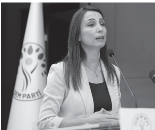
Auf den Vorschlag Öcalans wurde eine Kommission für "nationale Solidarität, Brüderlichkeit und Demokratie" im türkischen Parlament eingerichtet. Während ihre Arbeit andauert, bleibt auch das potentielle Ergebnis dieser Kommission weiterhin im Unklaren.