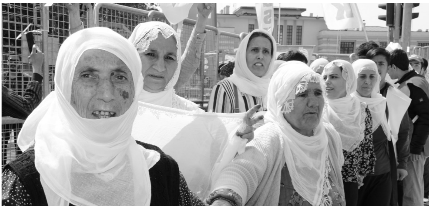
Mütter von Gefangenen vor der 1. Mai Kundgebung in Amed (Diyarbakir) 2019. Ihnen wurde der Zutritt zur Kundgebung erst nach heftigem Protest gewährt. Die von kurdischen Müttern traditionell getragenen weißen Tücher sollten verboten werden.

Im Gefängnis lebt man jede Minute der 24 Stunden bewusst. Ob geplant oder ungeplant – jeder Tag, jede Stunde, jede Minute, jede Sekunde muss gelebt werden. Die Zeit fließt nicht einfach dahin – man selbst lässt sie vergehen. Das hinterlässt tiefe Spuren in der Seele. Man lernt den Staat besser kennen und findet so neue Wege, ihm besser organisiert zu begegnen. Gleichzeitig steigt das Bewusstsein für Widerstand auf ein Maximum. Je stärker der Druck, desto größer der Wille zum Widerstand. Wenn dieses Bewusstsein in organisierte, gleichberechtigte Gemeinschaft umgewandelt wird, wird das Gefängnis zu einem Ort des Widerstands und der Neuschöpfung des eigenen Selbst.