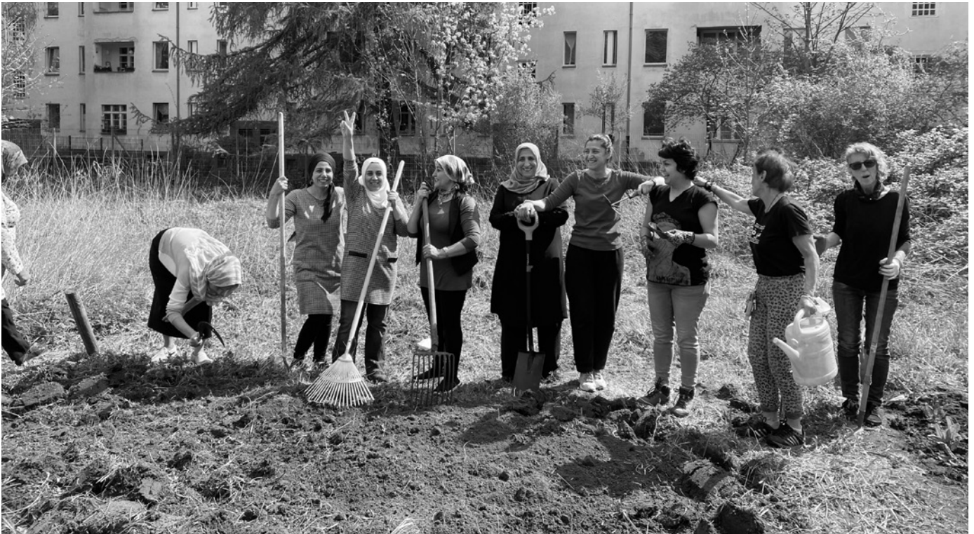
Frauen bereiten im Hevrîn Xelef Garten in Berlin die Beete für die Aussaat vor.

schaft (und Linke) damit kämpfen, zu verstehen, dass keine Struktur, die wir aufbauen, ohne das Verstehen der Wurzeln aller Enteignungs- und Erfolgsgeschichten langfristig stabile Strukturen hervorbringen kann.