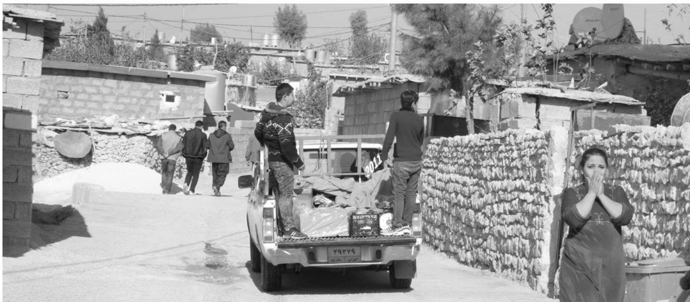
Blick in den Alltag des Camp Mexmûr.

Einzugsbereich der PKK-Guerilla. Ohne schützende Unterkünfte und Versorgung konnten die Menschen den harten Winter 1994 nicht überleben und erklärten sich schließlich bereit sich weiter entfernt von der Grenze zu ihrer Heimat anzusiedeln zu lassen. Als die erste Gruppe auf den offenen Ladeflächen der Lastwagen am neuen Ort Tal Qiyametê ankam, sahen die Geflüchteten zum ersten Mal Zelte mit der Aufschrift »UNHCR«. Aus unbekanntem Gründen musste die zweite Gruppe der Flüchtlinge zurückbleiben. Erst Anfang 1995 konnten sie sich in Etruş niederlassen. Wieder wurde viel Kraft in den Bau von Schulen und Gemeindeeinrichtungen gesteckt und die Infrastruktur für ein funktionierendes kommunales Leben geschaffen mit der Hoffnung bleiben zu können. Aber im August 1995, mit Beginn des Krieges zwischen PKK und KDP, zerschlug sich auch diese Hoffnung. Zwischen die Fronten geraten, begann eine erneute Odyssee für die aus Bakur geflüchteten Menschen. Beide Gruppen waren gemeinsam der Gewalt der Türkei und der KDP ausgesetzt. Hunger und Waffengewalt kosteten vielen Menschen das Leben.