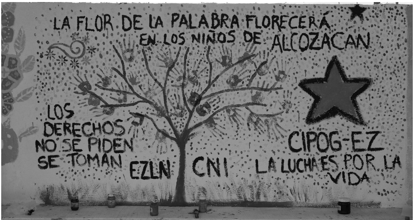
»Die Blume des Wortes erblüht in den Kindern von Alcozacan« / »Wir betteln nicht um unsere Rechte, wir nehmen sie uns« / »EZLN, CNI, CIPOG-EZ, Der Kampf ist für das Leben« - Wandgemälde in einer der im CIPOG-EZ organisierten Gemeinden. Foto: CIPOG-EZ

sind vom Drogen- und Menschenhandel bis Forst- und Landwirtschaft in allen Bereichen aktiv.