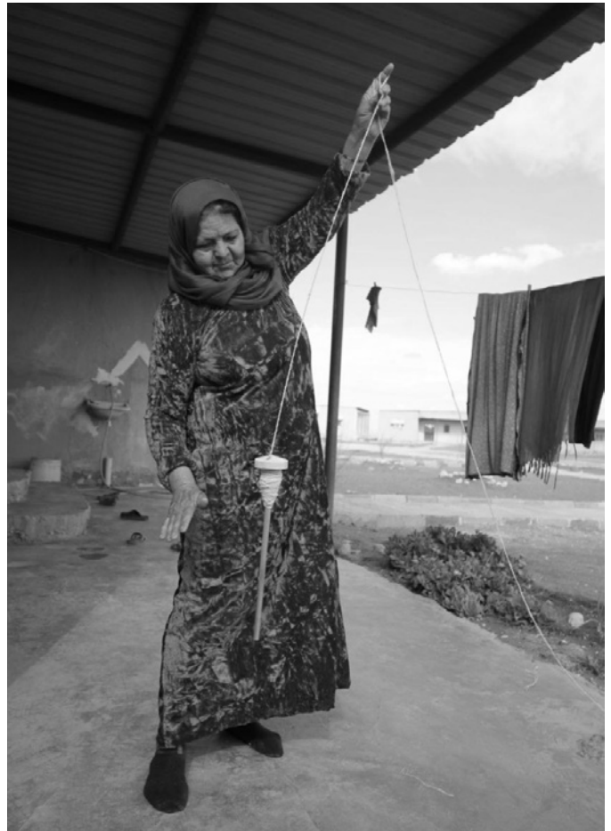
Im Frauendorf Jinwar in Rojava produzieren die Frauen Lebensmittel und andere grundlegenden Produkte wie Wolle und Garn selbst.

Die oben genannten Themen sind sehr umfangreich und erfordern intensive Diskussionen und praktische Erfahrungen. Wir haben versucht, die oben zusammengefassten Punkte, die für den Aufbau einer demokratischen Gesellschaft notwendig sind, und einige praktische Bedingungen in Kurdistan hervorzuheben. Die jüngsten politischen Entwicklungen in Kurdistan lassen eine neue Phase der demokratischen Entwicklung der Freiheitsbewegung erwarten. Es wird eine Phase sein, in der sich