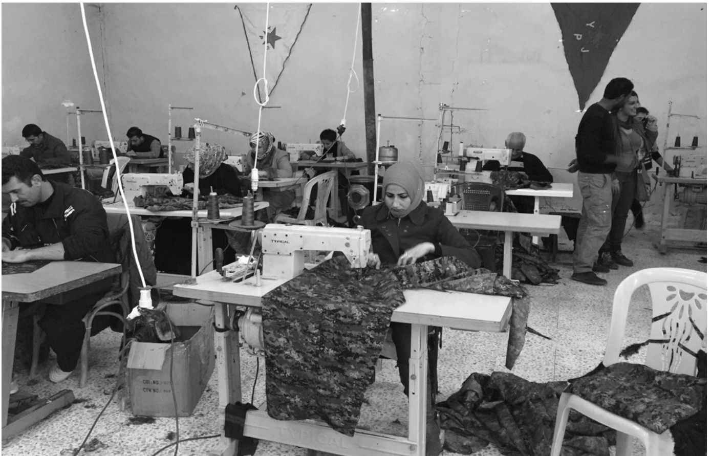
Eine Nähkooperative in Dêrik, Rojava.

organisieren Schulungen, damit alle Mitglieder der Kommune in der Kooperative arbeiten können, wenn sie dies wünschen. Auch hier unterstützen sie Kommunen, die Kooperativen gründen wollen, bei der Beschaffung von Produktionsmitteln, Ausrüstung, Wissen, Fähigkeiten, wirtschaftlichen Ressourcen usw. Sie übernehmen auch Aufgaben, wie zum Beispiel die Beantragung von kommunalem Land bei der Selbstverwaltung oder die Zusammenarbeit mit landwirtschaftlichen Einrichtungen, um Brennstoffe, Saatgut, Maschinen usw. zu bekommen. Die andere Aufgabe der Kooperativenzentren besteht darin, 5% der Einnahmen aller Kooperativen einzusammeln, die wie folgt verteilt werden: 2% der Beiträge gehen an Fonds der Kooperativen, weitere 2% gehen an die Kooperativenzentren und 1% an den Kooperativenverband. Mit diesem Beitrag unterstützen die Kooperativenzentren und der Kooperativenverband die Gründung neuer Kooperativen.